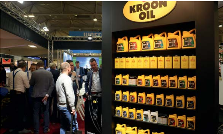
Ook op het gebied van olie en smering valt er genoeg te leren.

'DE BEZOEKERS KWAMEN ALLEMAAL MET GERICHTE VRAGEN'