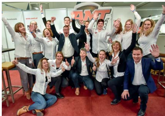
Wij hebben genoten van AMT Live, en eind januari kun je AMT Live opnieuw bezoeken tijdens de AutoProf – AMT Live in Gorinchem. Tot dan!