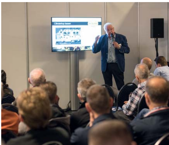
De kennissessie van De Sutter draaide om mechanische problemen en revisies.