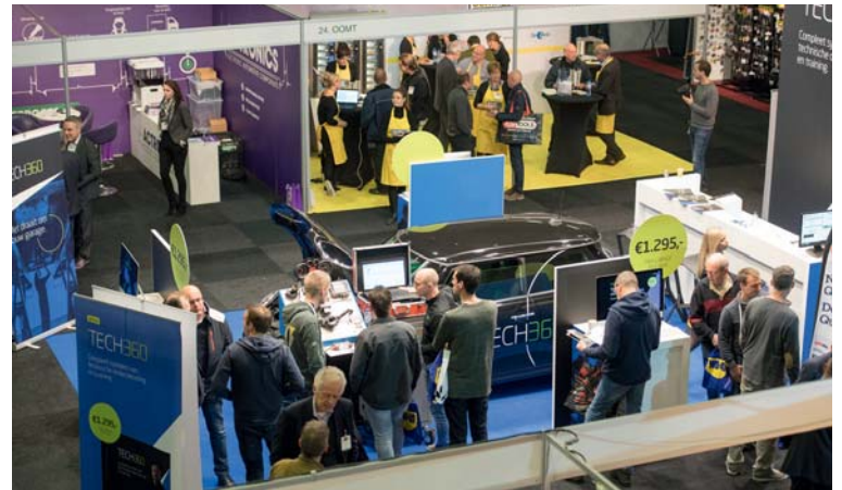
Op de stand van Tech360 draaide het om pass-thru. Hoe voer je dit uit? Een en ander werd live gedemonstreerd.